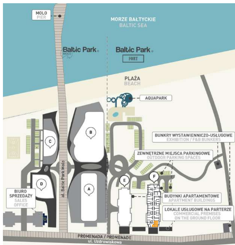
Kompleks i lokalizacja lokalu na piętrze I Complex and location of the apartment on the floor