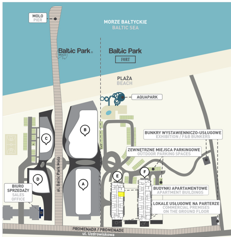
Kompleks i lokalizacja lokalu na piętrze | Complex and location of the apartment on the floor