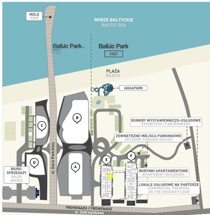
Kompleks i lokalizacja lokalu na piętrze | Complex and location of the apartment on the floor