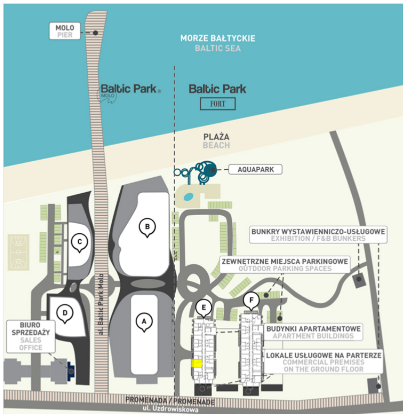
Kompleks i lokalizacja lokalu na piętrze | Complex and location of the apartment on the floor