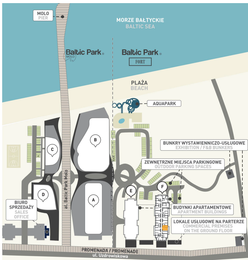
Kompleks i lokalizacja lokalu na piętrze I Complex and location of the apartment on the floor